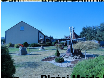
Pan Róża Mała Brzeźno