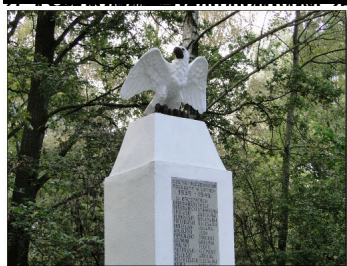
Widok z góry - CZĘŚĆ MŁCZENNIKOM POLEGŁYM W LATACH 1939